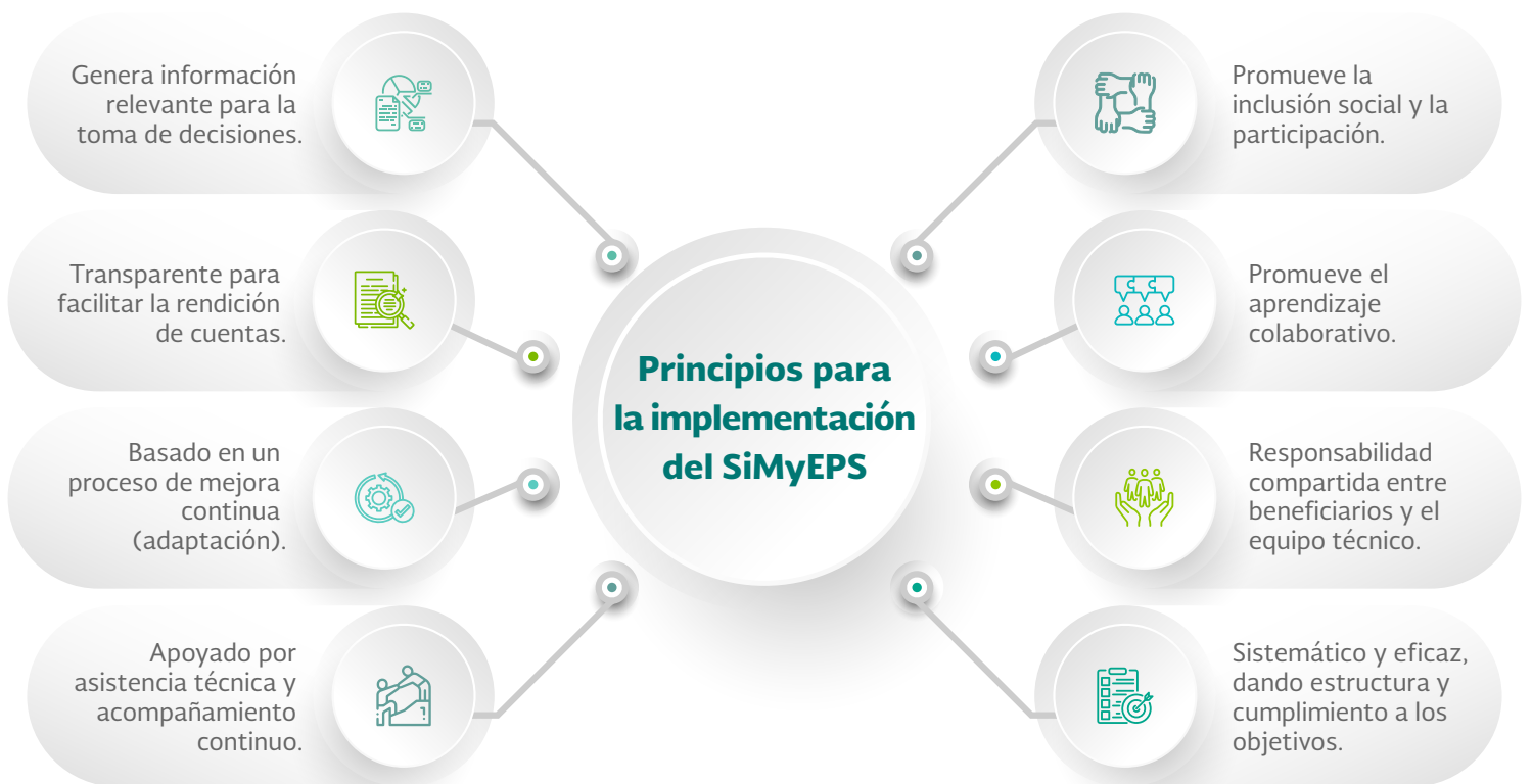
Figura 2. Principios para la implementación del SiMyEPS